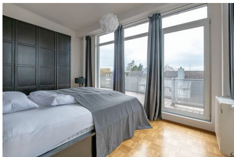
Schlafzimmer + Terrasse 2