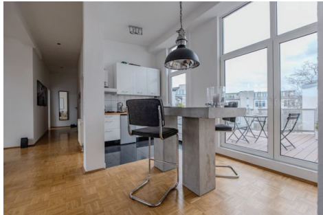
Wohn-Eßzimmer – Bild 1