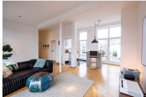
Wohnzimmer-offen zu Essbereich